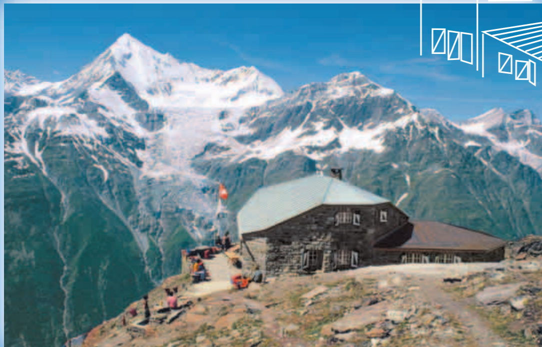
← Domhütte SAC ob Randa mit Blick auf's Weisshorn (4505 m)